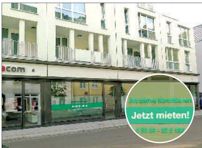
Große Teile der Gewerberäume in den MichaelisGärten stehen noch immer leer. Umfangreiche Sonderabschreibungen waren die Folge.

3. Der § 2 Absatz 2 gestattet der WHG, Gemeinschaftsanlagen und Folgeeinrichtungen, Läden und Gewerbebauten, soziale, wirtschaftliche und kulturelle Einrichtungen und Dienstleistungen bereitzustellen. Damit dies nicht zu Lasten der Mieter geht bzw. indirekt über die Miete finanziert wird, darf dies nur mit besonderer Ermächtigung (z.B. Beschluß der Stadtverordnetenversammlung) gestattet werden. Es ist zu sichern, daß die Wahrnehmung von Aufgaben nach Absatz 2 nur bei nachgewiesener Wirtschaftlichkeit der Einzelmaßnahme erfolgt.