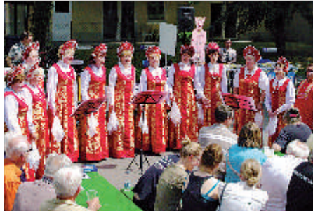
Kultureller Höhepunkt des Pressefestes

Es sind vor allem unsere Förderabonnenten, die mit ihren Spenden dafür sorgen, daß wir