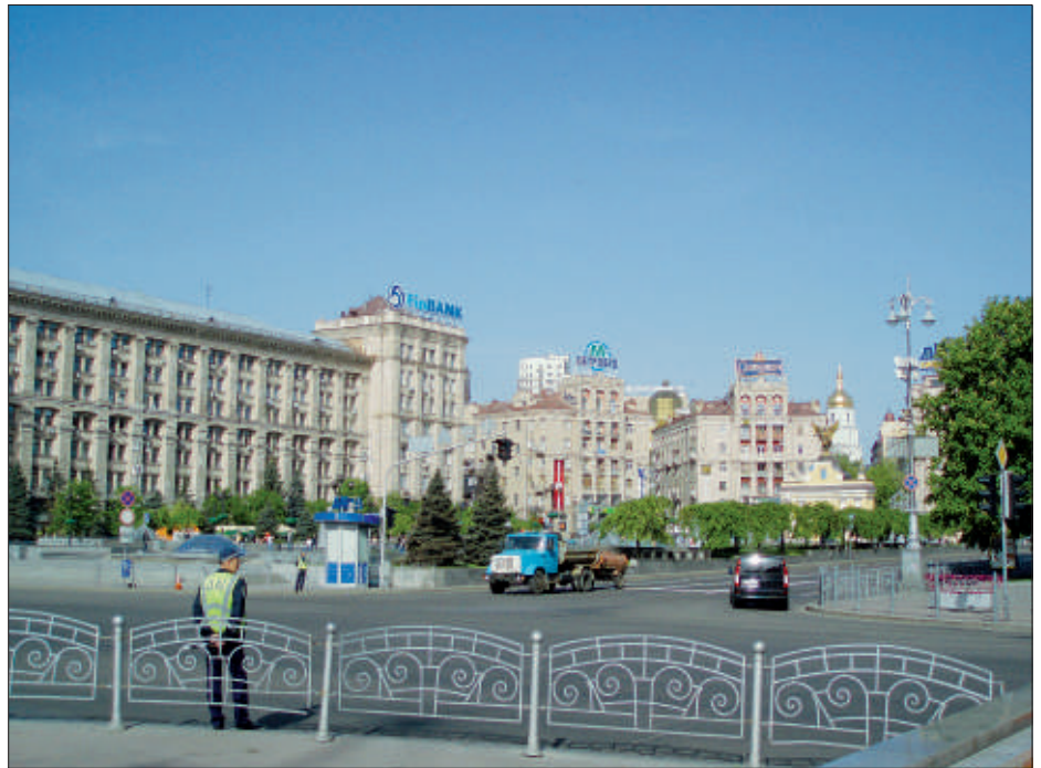
Der Krestschatik im Zentrum von Kiew mit Blick auf die andere Seite des Maidan.

Die aktuelle Lage in der Ukraine ist jetzt ein Dauerthema der westlichen Medien, die sich mit Berichten überschlagen. Meist sind diese leider einseitig, verschweigen viel und schlagen vor allem pausenlos auf die jetzige Regierung und »Rußland« (Putin) ein. Sie werden schon als »Machthaber« bezeichnet, als ob sie nicht gewählt worden wären. Man weint Krokodilstränen um das ukrainische Volk.