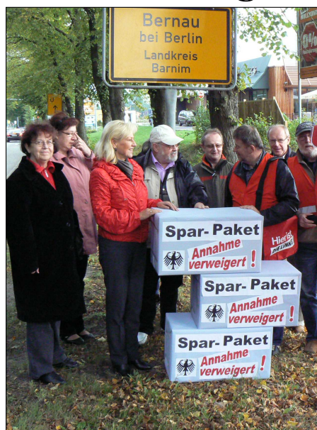
Die Bernauer LINKEN protestieren gegen das »Sparpaket« der Bundesregierung.