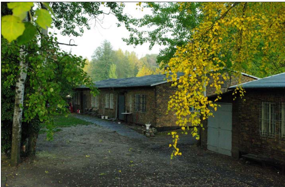
Der Platz vor den KZ-Baracken wirkt aufgeräumt, sauber und gefegt – auch zwei Wochen nach der Steleneinweihung. Nach der Klärung der Eigentumsverhältnisse kann nun daran gegangen werden, die Baracken zu einem Ort der Mahnung, der Begegnung und des Austauschs zu machen.