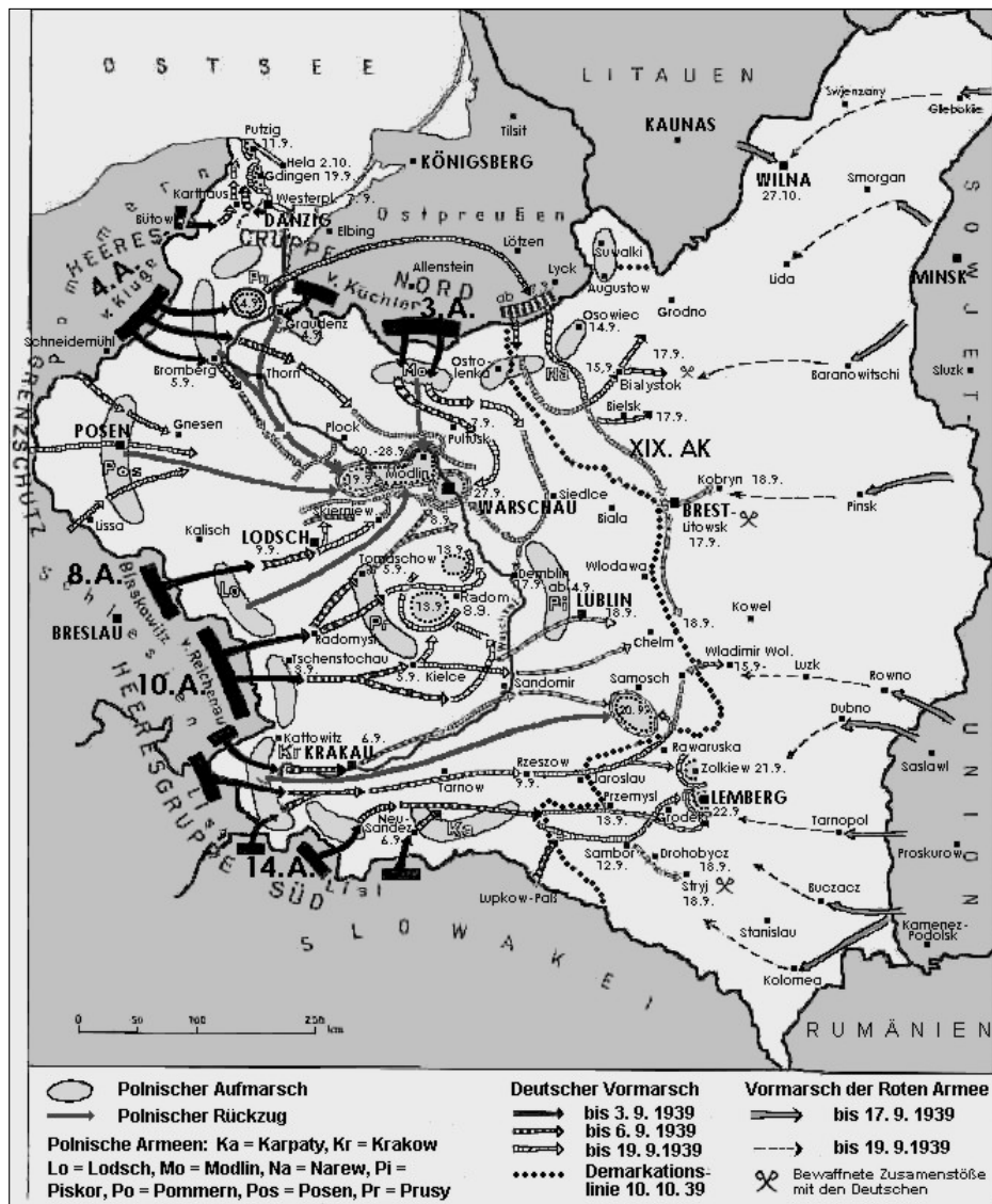
Der Verlauf des deutschen Angriffs auf Polen (1. 9. -2. 10. 1939) und der Besetzung Ostpolens durch die Rote Armee.

heiten beteiligt waren, ist nicht ersichtlich. Jedenfalls hatte die Rote Armee Anweisung, Waffengebrauch gegen Polen zu vermeiden. Marschall RYDZ-SMIGLY informierte seinerseits die polnischen Einheiten am 17. September: »Die Sowjets sind einmarschiert. Ich befehle den allgemeinen Rückzug nach Rumänien und Ungarn... Mit den Sowjets ist nicht zu kämpfen.« Das Garnisonskommando Lemberg (Lwow) wurde angewiesen: »Wir kämpfen nur gegen Deutschland. Mit den Bolschewisten führen wir keinen Krieg« /1, S. 135 f./. Dementsprechend gab es nur eine nach Westen gerichtete Verteidigungslinie für Lemberg. Eine Militärallianz sieht eigentlich anders aus.