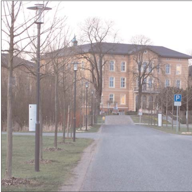
Einst schmückte eine stolze Kastanienallee die Zufahrt zum Gropiusbau der Landesclinik. Im Jahr 2000 wurde sie mitten im Sommer gefällt, obwohl Dreiviertel der Bäume noch genügend Vitalität aufwiesen. Die nachgepflanzten Bäume haben nach 7 Jahren die Höhe der Laternen erreicht

Anfang Juli 2000 herrschte, wie es in einem Bericht der lokalen Tageszeitung heißt, Aufregung in der Oderberger Straße in Eberswalde. Anwohner hatten beobachtet, wie Arbeiter den Kastanien entlang der Straße, die zum Gropiusbau der Landesclinik hin führt, mit der Säge zu Leibe rückten. Die Schnittstellen seien völlig sauber und zeigten keine dunklen Stellen, wird eine Anwohnerin zitiert. Krank seien die Bäume ihrer Auffassung nach nicht. »Und im Frühjahr standen die Kastanien immer in voller Blüte«. Die Ausnahmegenehmigung zur Fällung der Allee hatte die Untere Naturschutzbehörde (UNB) des Landkreises erteilt.