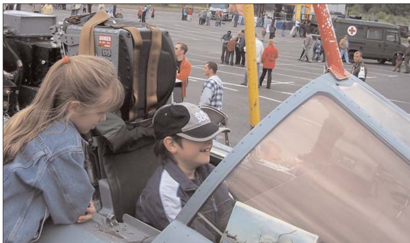
Kinder im Cockpit von Kriegsflugzeugen während der Luftwaffenschau 2004 in Eberswalde. Bereits 1999 hatte der Kreistag den Beschluß von 1990 zum »Militärfreien Kreis« in aufgeheizter militaristischer Atmosphäre aufgehoben. Zwei Kriegswaffenschauen in Eberswalde folgten. Nunmehr werden die kommunalen Strukturen fest in die Vorbereitungen der Bundeswehr für Einsätze im Ausland und im Innern eingebunden.

Die neuen Kommandos für Zivil-Militärische Zusammenarbeit stehen im Zusammenhang mit der Umstrukturierung der Bundeswehr zu einem global einsetzbaren Interventionsheer. Die alten, auf einen Landkrieg mit benachbarten Staaten ausgerichteten Strukturen gehören der Vergangenheit an. Die Truppe wird verkleinert, Standorte werden aufgegeben, Einheiten aufgelöst. Dazu gehören auch die bisher für den »Heimatschutz« zuständigen Verteidigungsbezirkskommandos und weitere Truppenteile des Territorialheeres.