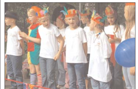
Der Kindergarten Villa Kunterbunt in Finow feierte am 9. September den 50. Jahrestag seines Bestehens. Die Kinder gestalteten ein buntes Programm für ihre Eltern und die anderen Gäste.