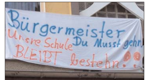
Die streikenden Schüler der Einsteinschule brachten es schon vor dem erneuten Harikiri eines Eberswalder Bürgermeisters auf den Punkt.

Selbst wenn die Einlassung von Herrn Schulz stimmt und er zu Hause noch ein Bier getrunken haben will, bevor die Polizei auf sein Grundstück kam, dürfte die Alkoholfahrt, wenn auch mit geringerer Promillezahl, begangen worden sein.