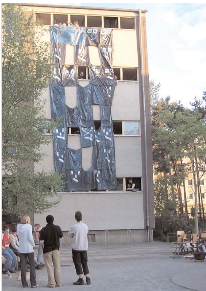
Ausgefallene Fassadengestaltung an der Albert-Einstein-Oberschule. Die 33 Plastensäcke mit aufgemalten Gesichtern symbolisieren die 33 für die Klassenstufe 7 angemeldeten Schülerinnen und Schüler. Doch im Riesenplakat klaffen 7 Lücken, laut Staatlichem Schulamt entscheidende Lücken ...

Laut Brandenburgischem Schulgesetz sind auch Klassenstärken mit 15 Schülern möglich