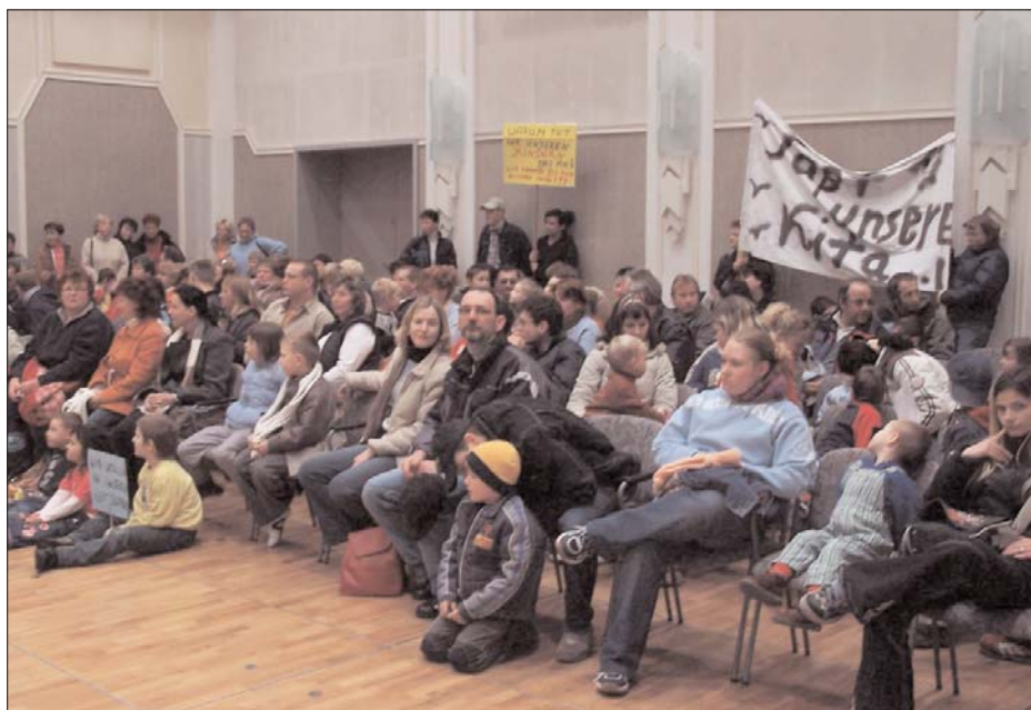
Mehr als 100 Eltern mit vielen kleinen Kindern waren am 23. März gekommen, um die Debatte der Stadtverordneten zu verfolgen. »Laßt uns unsere Kita« appellierten sie an ihre Volksvertreter. Vergeblich, wie sie frustriert feststellen mußten, als nach langem Warten über die Kitakonzeption der Stadt abgestimmt wurde.