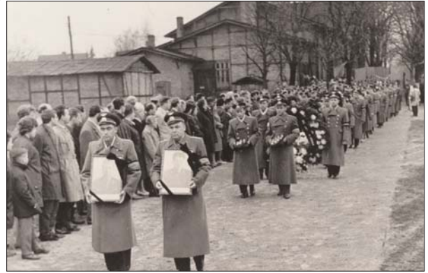
An dem Trauermeeting im April 1966 nahmen auch zahlreiche Einwohner Finows teil.