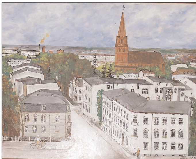
SIEGFRIED KERSTEN Blick auf Eberswalde, Öl