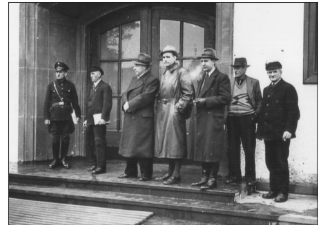
Die »Führer« vom Waldlager Britz. Auf dem Foto unten zeigt Lagerbaracken kurz vor ihrem Abriß.

Die Gefangenen erhielten je nach ihrer Herkunft ein Zeichen, welches auf den Rücken genäht wurde. Die Juden erhielten einen Judenstern, die Polen ein großes »P«, die Russen ein großes »OST«, die französischen Gefangenen ein »KG«, die Zigeuner ein großes »X«.